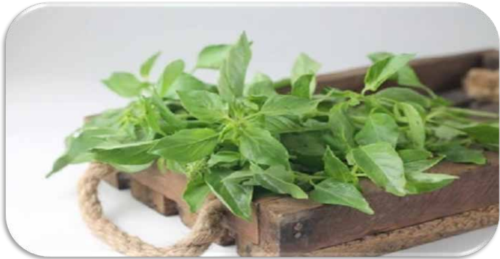
Ar-Raihan, Ocimum basilicum Linn, Kemangi.

Ibnu Qayyim Al-Jauziyah (2004: 381-382), menuliskan Raihan atau daun ruku-ruku/daun Kemangi adalah tumbuhan yang wangi dan berbau harum. Khasiatnya adalah meringankan sakit kepala, Daun kemangi berkhasiat menghentikan mencret, mencegah timbulnya panas dan lembab dari dalam tubuh, menenangkan detak jantung dan menimbulkan kegembiraan.