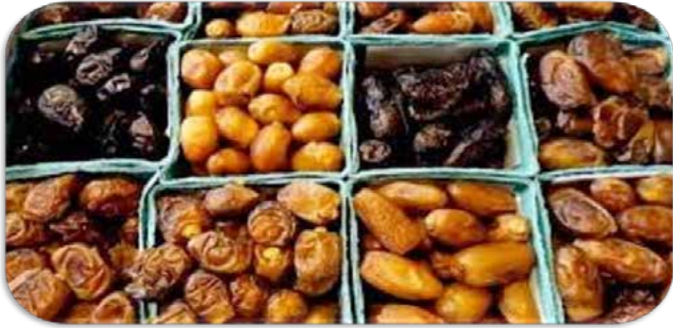
Nakhl, Phoenix Dactylifera Linn, Kurma.

Ibnu Qayyim Al-Jauziyah (2004: 356) menyebutkan Kurma dapat menguatkan lever, melunakkan buang air besar, menambah stamina. Kurma termasuk buah yang paling banyak mengandung gizi yang mengenyangkan dan dibutuhkan tubuh.