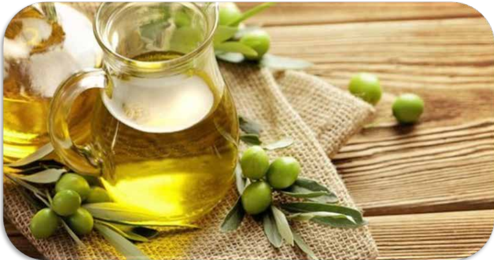
Zaitun, Olea europaea Liin.

Kandungan lemak monounsaturated dalam minyak Zaitun dihubungkan dengan pengurangan resiko terkena penyakit jantung koroner. Minyak Zaitun banyak mengandung monounsaturated yaitu oleic acid. Banyak bukti klinis, menggunakan minyak Zaitun memberikan keuntungan pada jantung, seperti: anti inflamasi (anti peradangan), anti thrombotic (anti penggumpalan darah), anti hipertensi, bersifat laxative (Muhammad Ismail, Luqman Ahmad, 2016: 87-88).