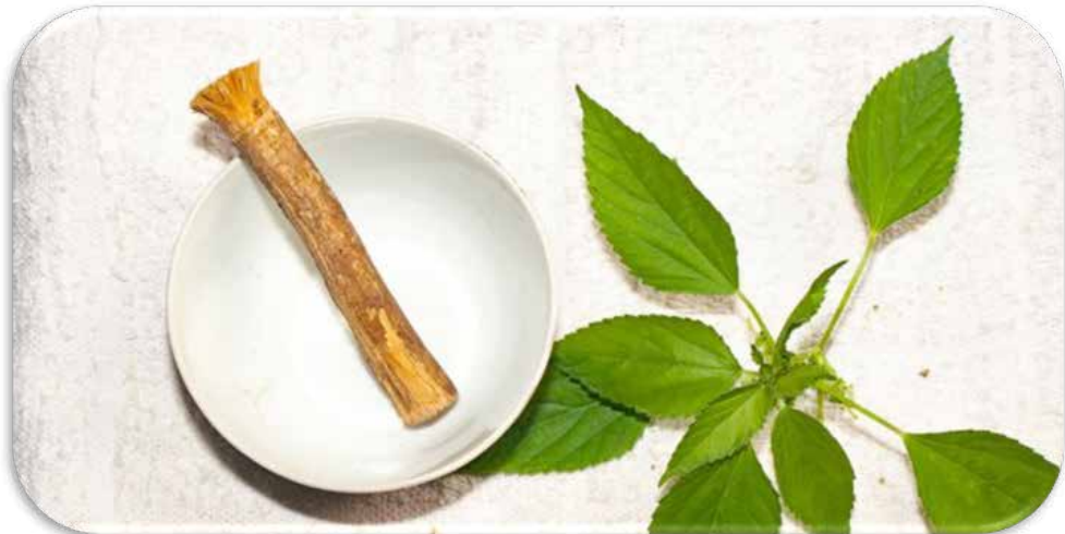
Khamt, Salvadors persica Linn, Siwak.

Siwak memiliki banyak manfaat, di antaranya mengharumkan mulut, menguatkan gigi, menghilangkan dahak, mempertajam pandangan mata, menghilangkan gigi keropos, menyehatkan lambung, menjernihkan suara, membantu pencernaan, mempermudah berbicara, memberi semangat dalam membaca, berdzikir dan shalat, mengusir ngantuk (Ibnu Qayyim Al-Jauziyah, 2004: 392).