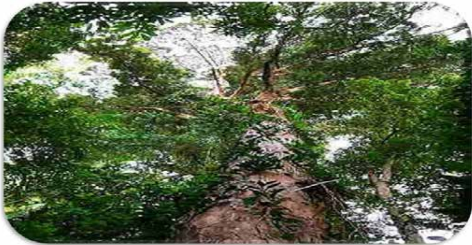
Kafur, Lawsonia inermis Linn.Syin.

Kafur zat eksotik langka dan berharga, pada zaman dulu sebagai hadiah para petinggi kerajaan. Menghirup aroma Kāpūr (dapat dicampur air mawar) untuk obat sakit kepala, menghentikan epitaksis, induksi tidur, antidiare, hemostatik, antipiretik, tukak paru, tuberkulosis, hepatitis, uretritis, radang selaput dada (Aswandi Anas, 2020: 6-8). Unsur yang dimanfaatkan dari pohon Kamper ini adalah kristal Kapur dan minyak Kapur. Kristal Kapur diperoleh dari bagian tengah (dalam) pohon (Sutrisna, 2008).