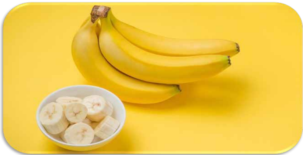
Talh, Acacia species, Pisang.

Pakar tumbuhan, Pline (wafat 79 SM), memuji keistimewaan buah Pisang. Pisang kaya kandungan hidrat karbon yang dapat memberikan tenaga dan kalori pada tubuh. Kadar gula dalam Pisang sangat tinggi, mencapai 24% dari berat buahnya. Kandungan lainnya: air (70-78%), protein (0,34-1,2%), lemak (0,4-0,9%), dan serat seluloid (0,5-1%).