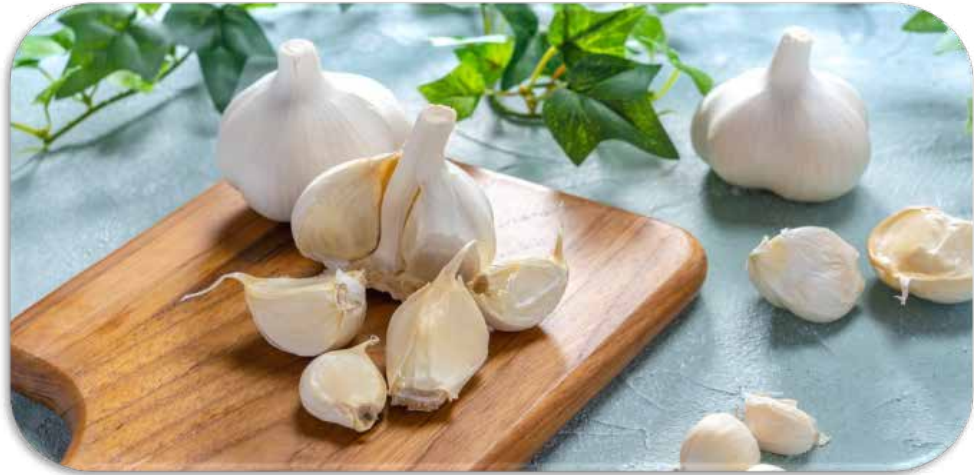
Fum, Allium Sativum L., Bawang Putih.