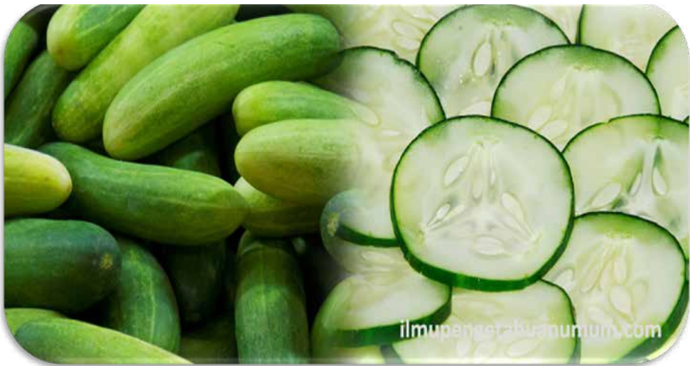
Qiththa, Cucumber, Mentimun.