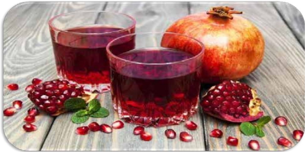
Ar-Rumman, Punica Granatum Linn, Delima.

Sya'ban Ahmad Salim (2012: 703-704), Delima yang manis dan basah sangat baik untuk perut, menguatkan perut karena mengandung daya pencegah diare yang lembut. Cairan yang dikandung buah ini menjadi pelembut bagi perut, serta sumber gizi yang melimpah bagi tubuh. Dapat untuk obat pencegah diare, bermanfaat untuk perut yang sedang mengalami peradangan, melancarkan aliran air kencing, menyembuhkan sakit kuning (hepatitis).