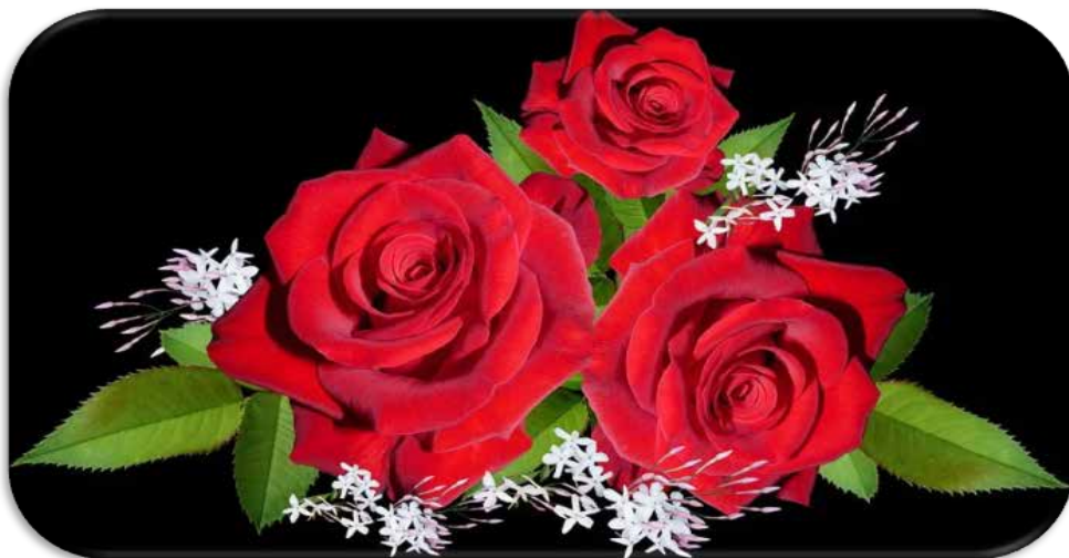
Ward, Rosa Species, Mawar.