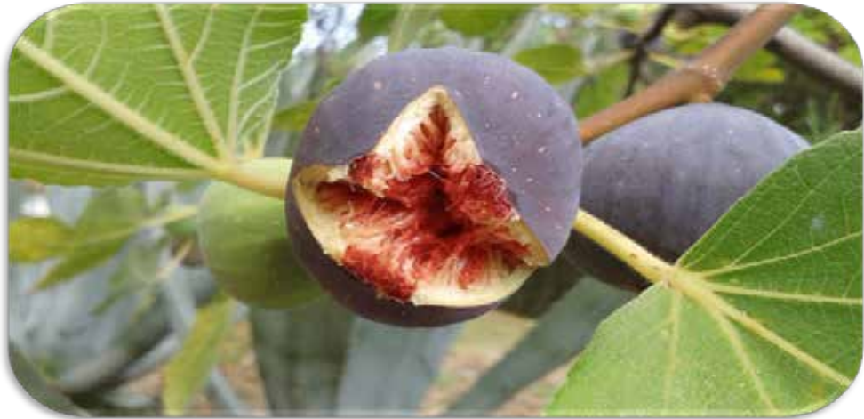
At-Tin, Ficus carica Linn., Buah Tin.

Sya'ban Ahmad Salim (2012: 663-664), Kandungan Buah Tin mengandung 16 unsur yang merupakan komponen yang dibutuhkan oleh tubuh manusia, terutama mineral berupa besi (Fe), kalsium (Ca), sodium, tembaga, potassium.