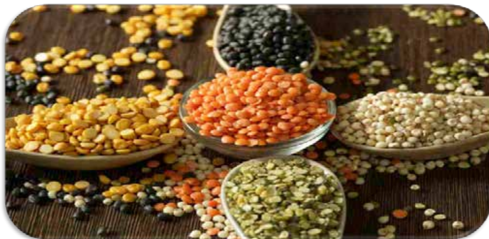
Adas, Lens Culinaris Medic , Kacang Adas-Lentil.

Kacang Adas atau Lentil mengandung polifenol tinggi, berguna untuk mencegah berbagai penyakit. Kandungan polifenol pada Lentil ini dibuktikan melalui penelitian dari International Journal Molecular Sciences . Pada penelitian tersebut ditemukan bahwa Lentil mengandung polifenol total tertinggi dibandingkan dengan enam kacang-kacangan lainnya, seperti kacang hijau dan kacang tanah. Polifenol yang ada pada Lentil diyakini dapat memberikan manfaat sebagai obat pelengkap dan alternatif (Situs HelloSehat).