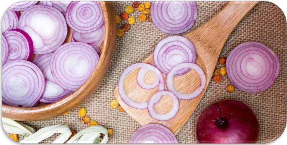
Basal, Allium Cepa Linn, Bawang Merah.

Sebagai obat tradisional dapat menyembuhkan demam, kencing manis dan batuk. Bawang merah mengandung kuersetin, antioksidan yang kuat -bertindak sebagai agen menghambat sel kanker. Kandungan lain dari bawang merah: protein, mineral, sulfur, antosianin, karbohidrat, dan serat (Rodrigues et al. , 2003). Bawang mengandung flavonoid yang telah diketahui untuk mendeaktifkan banyak karsinogen potensial dan pemicu tumor, seperti mengganggu pertumbuhan sel sensitif estrogen pada kanker payudara (Anonim, 2007).